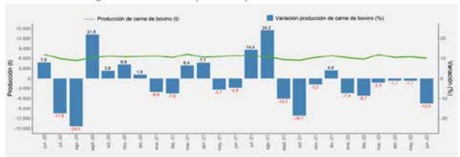
Evolución de la producción del ganado bovino en las regiones de Los Ríos y Los Lagos Variaciones a igual mes año anterior (2020-2022)