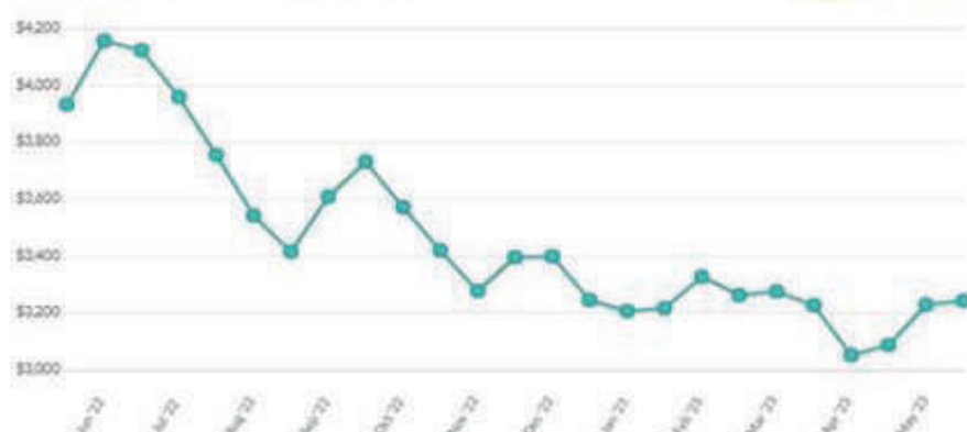
Whole Milk Powder Average Prices